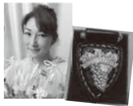
“ワインエキスパートの資格バッジと私です”

ですが、そのきつかけは？ ■私のワイン好きをご存じだった方が、ワイン資格取得のスクール開校を教えてくださいましたので、さつたのがきつかけです。簡単に取れるかなと思つて通い始めましたがあまりに難しく、部屋中に自分で描いた世界地図を貼つて、中学の時より勉強しました。