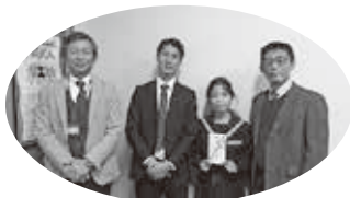
同窓会からもこれらの榮譽を称え、奨励金を贈りました。

く仕組みを提案した内容です。中央表彰式は中止でしたが、作文を収録した「第70回優秀作品集」は、21年3月に発行されています。