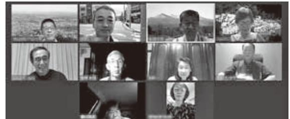
箕面一中でもオンライン授業で使っているTV会議 (Zoom) を使ったオンライン部会も開催しています。

青嵐会のホームページ(H P)はキーワード「箕面一中同窓会」でBindingやGoogleの検索でも発見できます。「今更ホームページ?」ではなく、どの世代でもどこにいても「卒業生が集える場所がある」ということを知っておいて欲しいと願います。 コロナ禍を予測していたわけではありませんが：昨年はフェイスブック・インスタグラム・ツイッターとチャネルを拡大し、ホームページの更新情報等をお知らせしています。