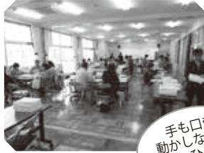
(一昨年の作業情景)

日程は毎年4月上旬までに、青嵐会HP (アドレスは http://seirankai.jimdofree.com/ ) に、掲載いたします。