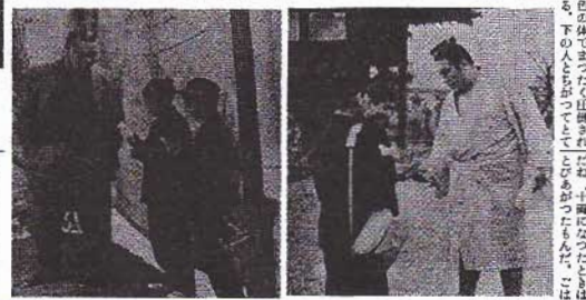
30貫が 庄倒されて口をあぐり 地響きたてるぶつかりげいこ 心をうたれた肉体のたんれん