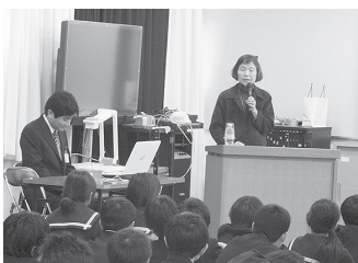
2年生 薬物乱用防止教室