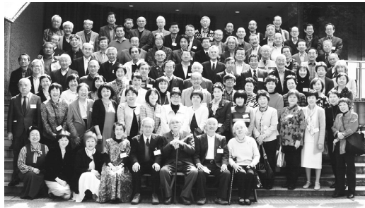
2015年3月21日 箕面一中18期生同窓会 於みのお山荘風の杜