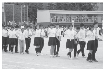
3年生 体育祭 フォークダンス 同窓生共通の青春の想い出