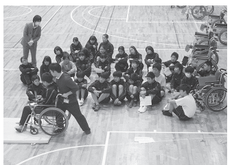
1年生 福祉体験で車椅子に